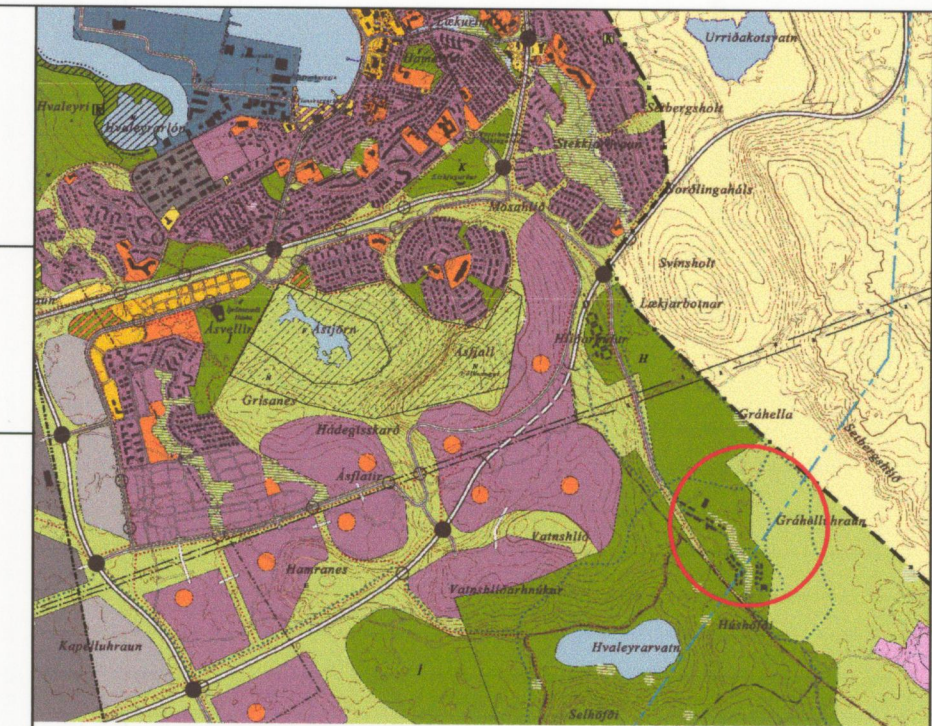
ADALSKIPULAG HAFNARFJARÐAR 2005-2025 Staðsetning í bæjarlandinu